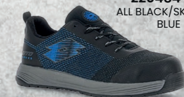
220484 AIA ALL BLACK/SKYDIVER BLUE